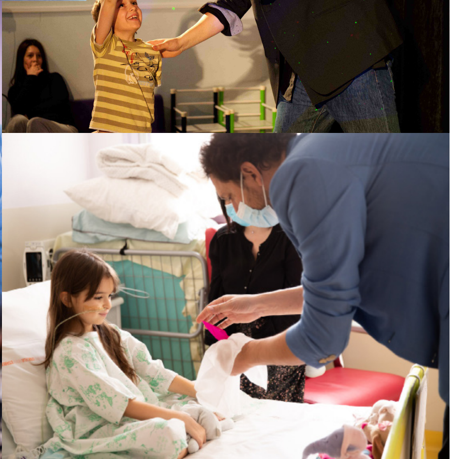
Interventions d'Éric Antoine avec Magie à l'hôpital auprès des enfants hospitalisés