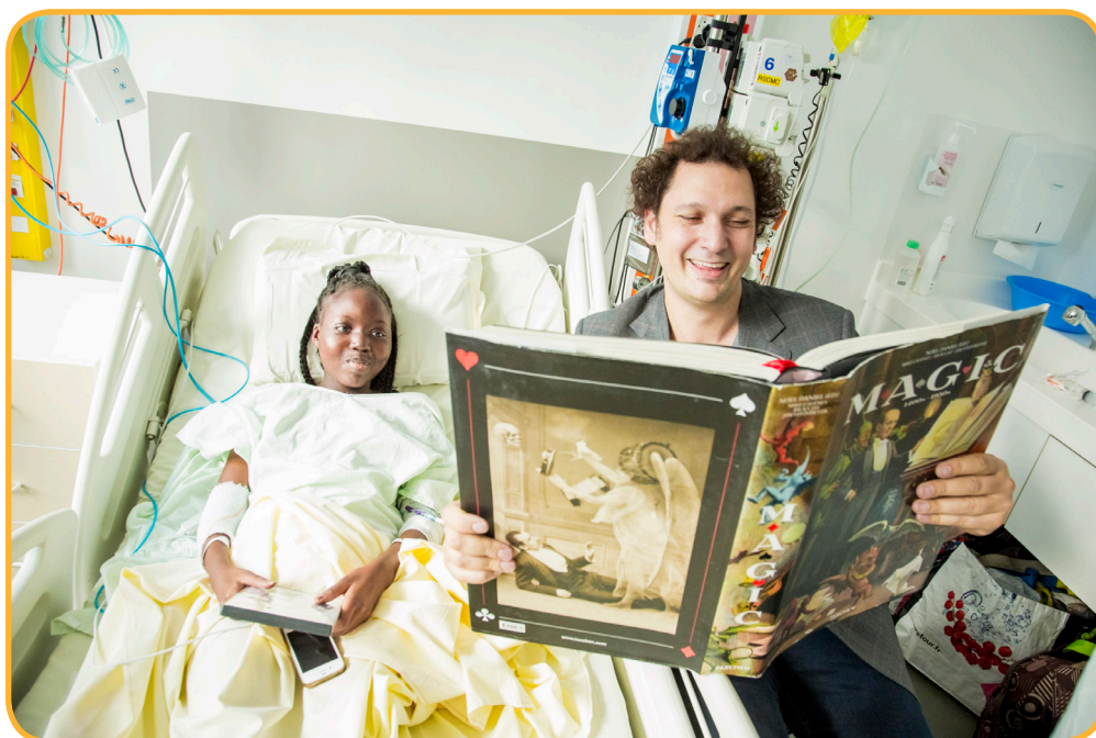
Intervention auprès des enfants hospitalisés à l'hôpital Necker - Enfants malades AP-HP à Paris en octobre 2018 en compagnie de Magie à l'hôpital.

Il signe son grand retour sur scène avec son tout dernier spectacle « Grandis un peu ». 35 représentations exceptionnelles aux Folies Bergère fin 2022 et actuellement en tournée dans toute la France. Pour les deux dernières dates de son spectacle, Éric Antoine était sur scène accompagné d'un orchestre symphonique à la Seine Musicale. Ce printemps est paru le 3 e tome de sa collection « Abracadabra », aux éditions jeunesse des livres du Dragon d'or .